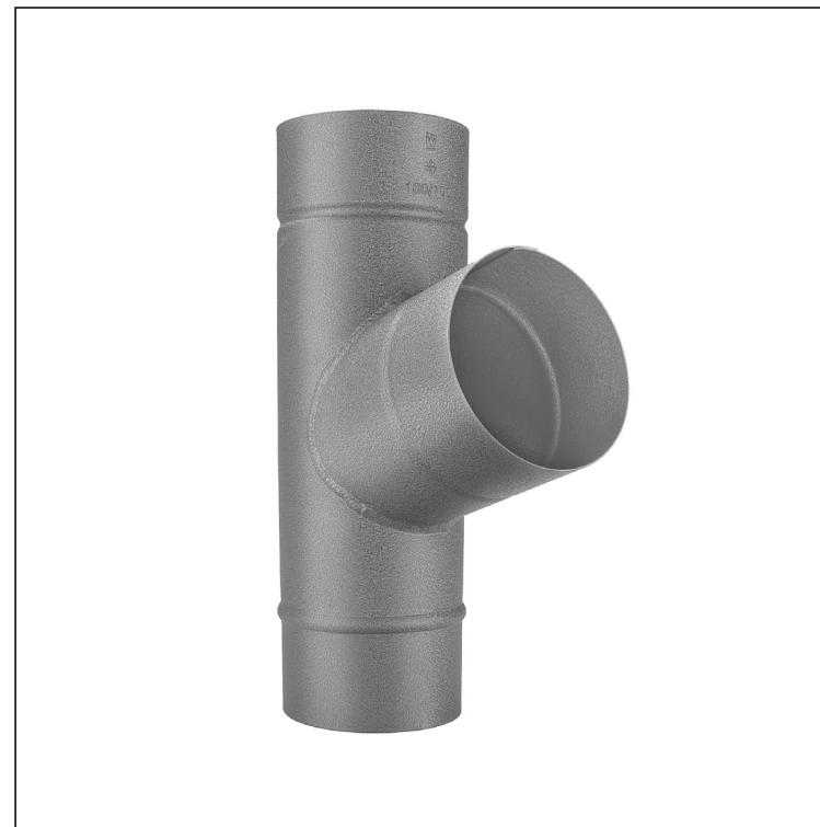
SSM Alumínium színes W.15 – Egérszürke W.15 – RAL 7005