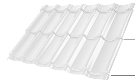
L – MODUL BURKOLAT OPTIM LIS HOSSZ 350 mm