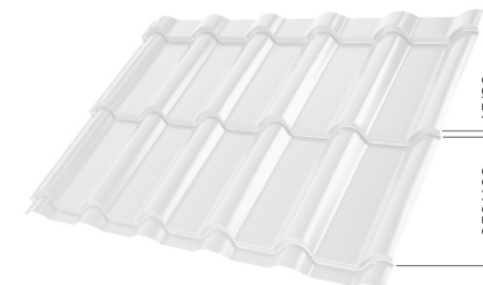
L – MODUL BURKOLAT OPTIM LIS HOSSZ 350 mm