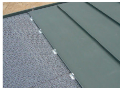
Példa a 8 mm-es strukturált gyékény használatára a KJG FALZ tetőburkolat alatt.

Poliamid 8 mm-es strukturált elválasztó réteg.