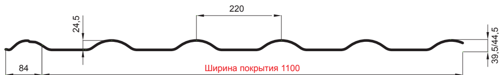
L – ОПТИМАЛЬНАЯ ДЛИНА ПОКРЫТИЯ ДЛЯ МОДУЛЯ 350 mm