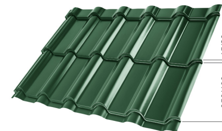
L – ОПТИМАЛЬНАЯ ДЛИНА ПОКРЫТИЯ ДЛЯ МОДУЛЯ 350 mm