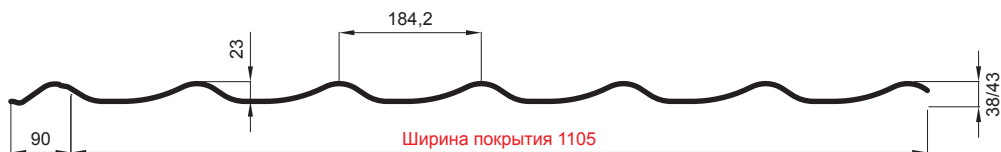
L – ОПТИМАЛЬНАЯ ДЛИНА ПОКРЫТИЯ ДЛЯ МОДУЛЯ 350 mm