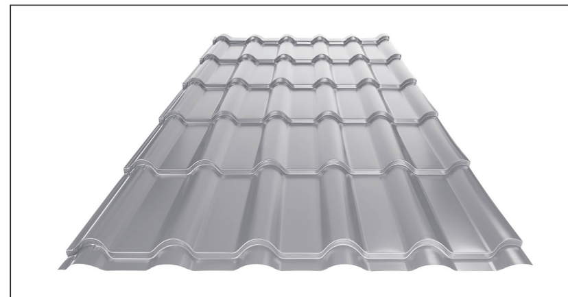
L – ОПТИМАЛЬНАЯ ДЛИНА ПОКРЫТИЯ ДЛЯ МОДУЛЯ 350 mm