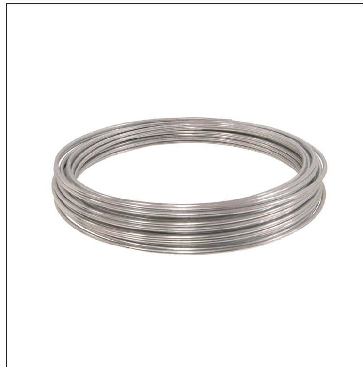
Алюминий – сплав AlMgSi