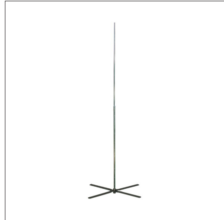
Стойка : Нержавеющая сталь Сборный стержень: Алюминий