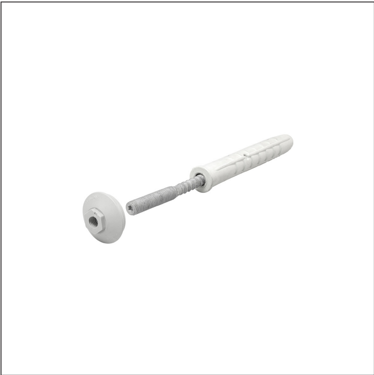
Оцинковка + ПВХ