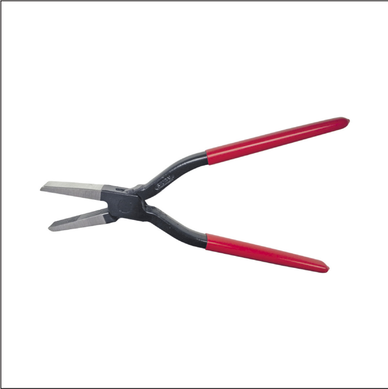
Углеродистая сталь С45