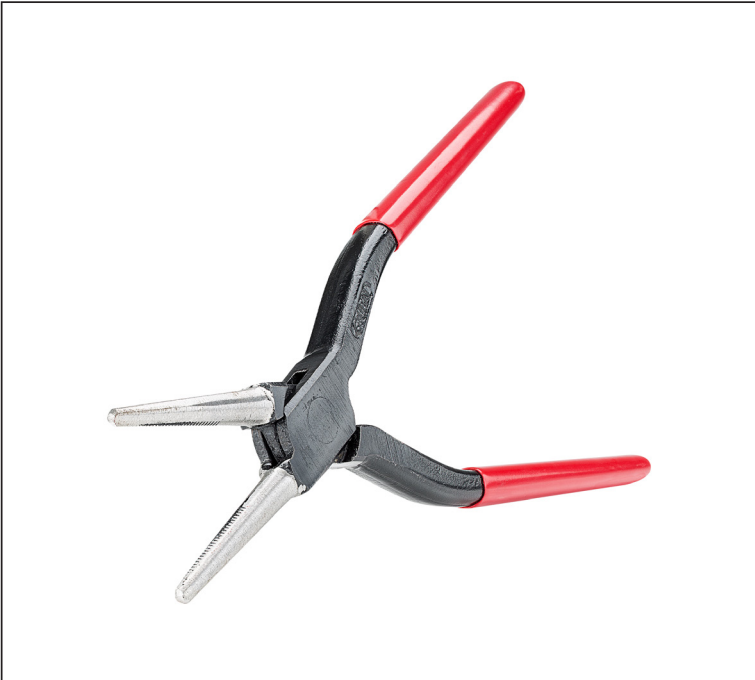
Углеродистая сталь С45