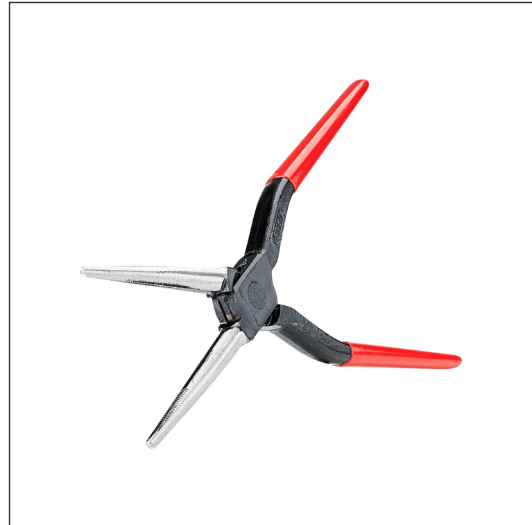
Углеродистая сталь С45