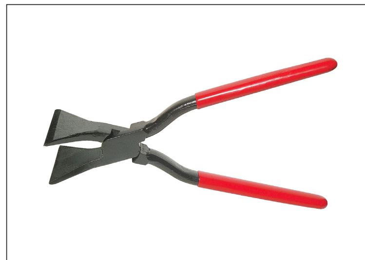
Углеродистая сталь С45