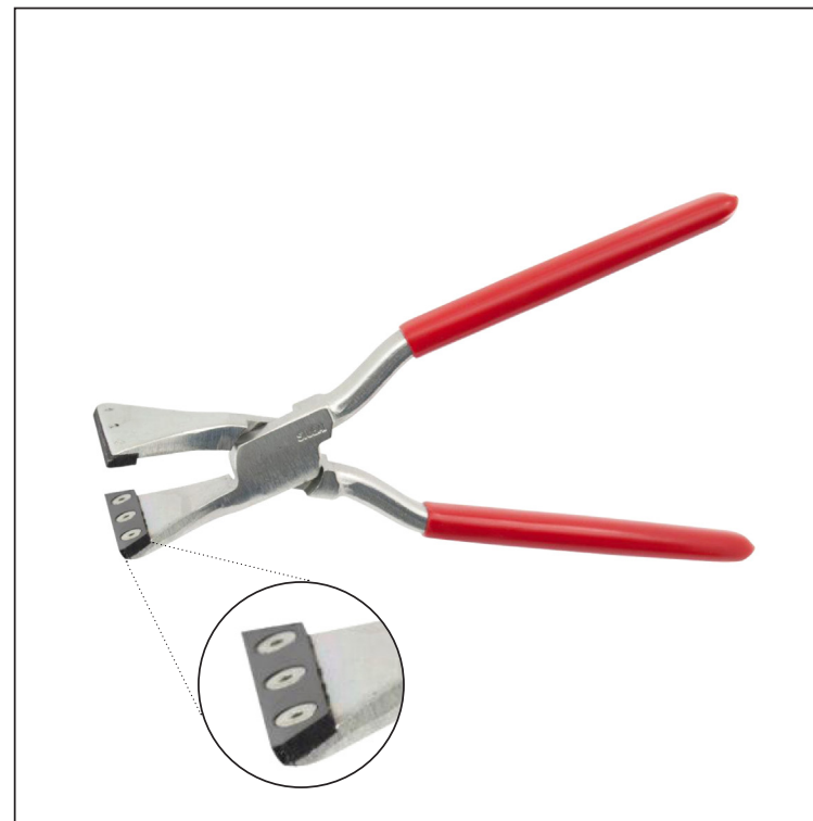
Углеродистая сталь С45