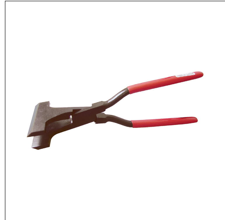
Углеродистая сталь С45