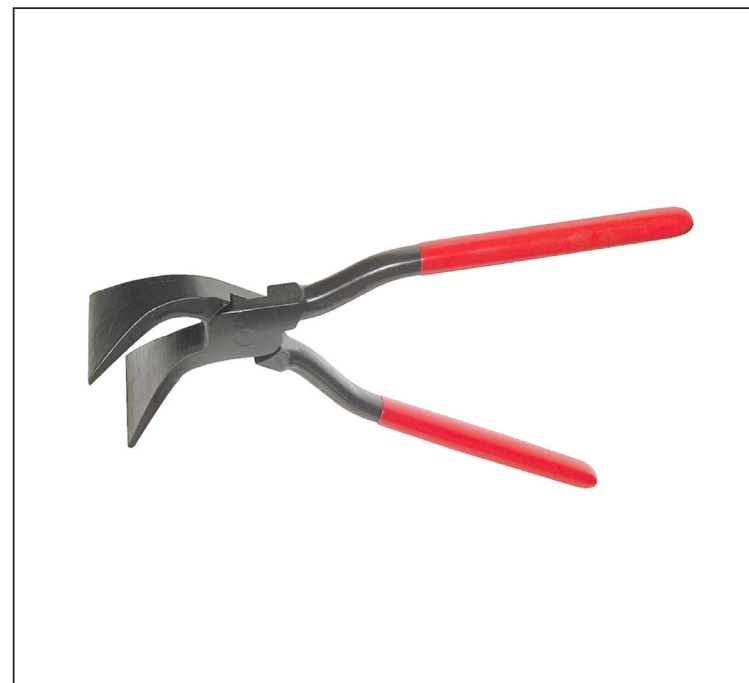
Углеродистая сталь С45