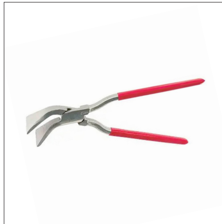
Углеродистая сталь С45