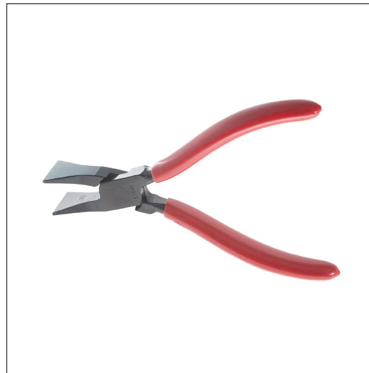
Углеродистая сталь С45