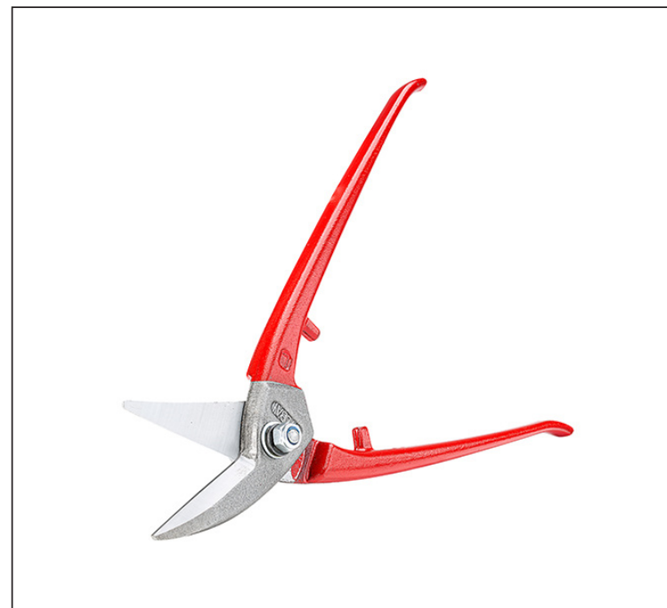
Углеродистая сталь С60