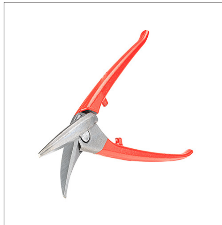
Высоколегированная инструментальная сталь