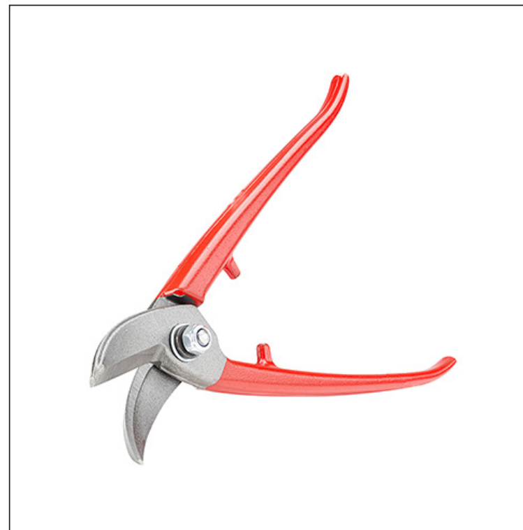
Углеродистая сталь С60