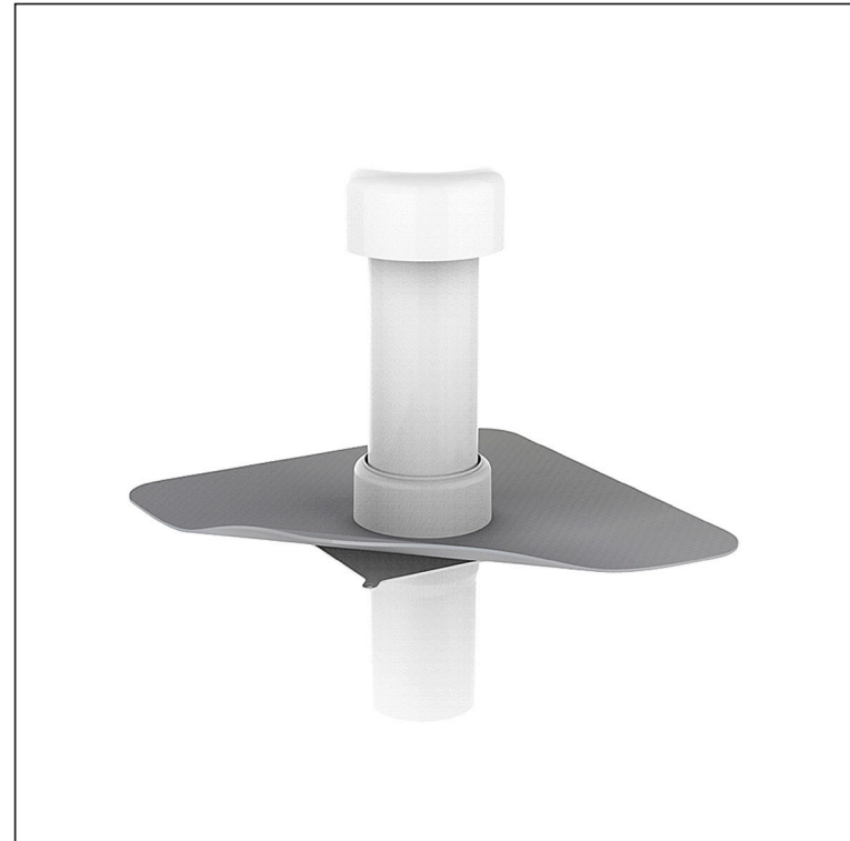
B ПВХ – Белый – RAL 9010