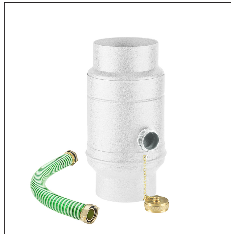
BM Aluminij barvni W.15 – Bela W.15 – RAL 9010