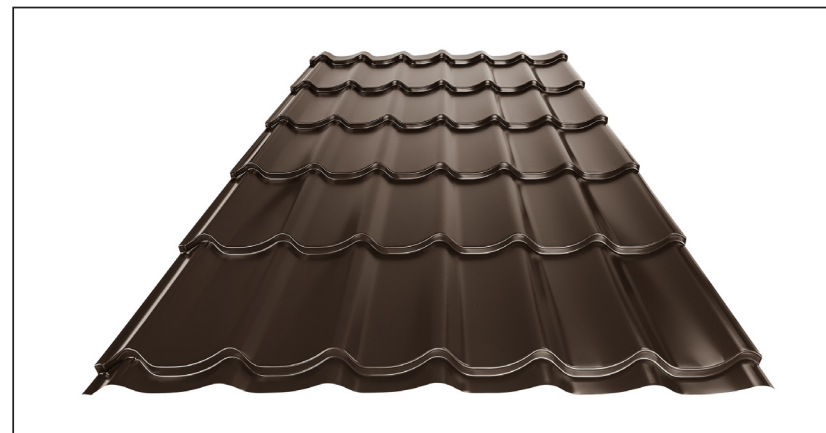
L – OPTIMALNA DOLŽINA KRITINE ZA MODUL 350 mm