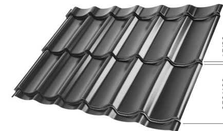
L – OPTIMALNA DOLŽINA KRITINE ZA MODUL 350 mm