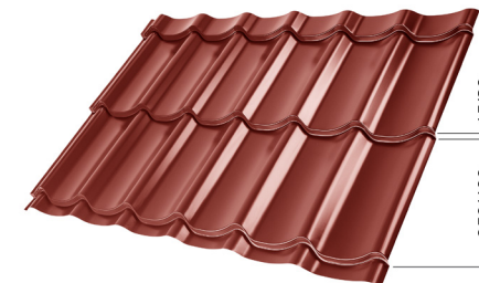
L – OPTIMALNA DOLŽINA KRITINE ZA MODUL 350 mm