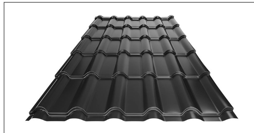
L – OPTIMALNA DOLŽINA KRITINE ZA MODUL 350 mm