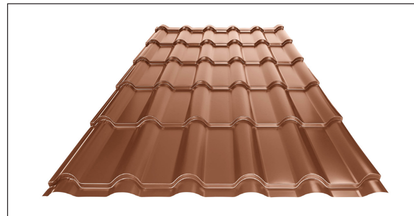
L – OPTIMALNA DOLŽINA KRITINE ZA MODUL 350 mm