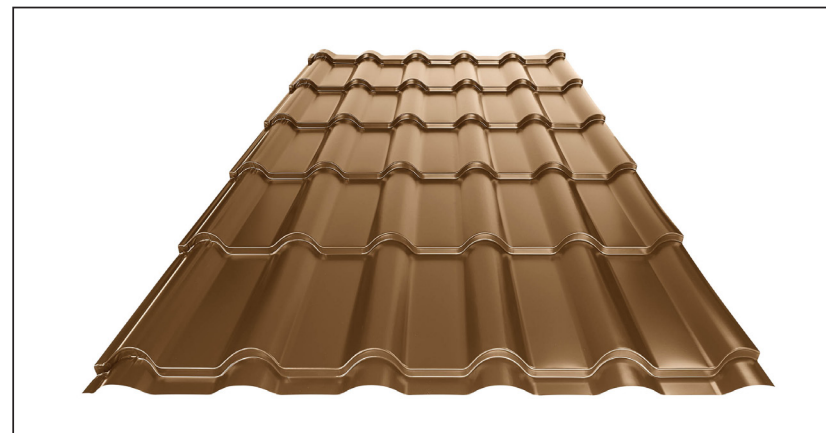
L – OPTIMALNA DOLŽINA KRITINE ZA MODUL 350 mm