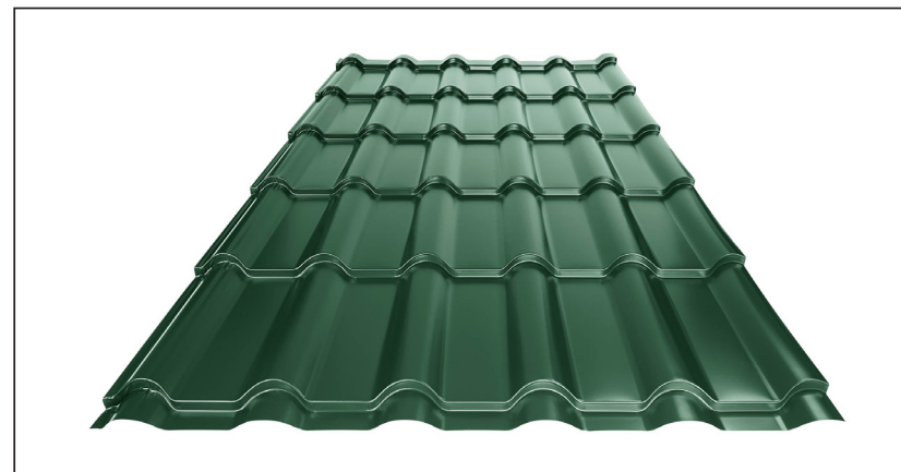
L – OPTIMALNA DOLŽINA KRITINE ZA MODUL 350 mm