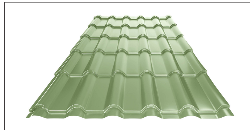
L – OPTIMALNA DOLŽINA KRITINE ZA MODUL 350 mm