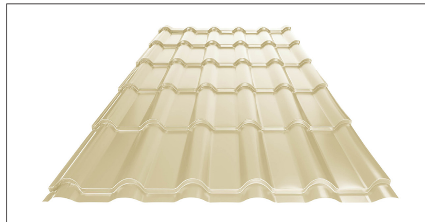
L – OPTIMALNA DOLŽINA KRITINE ZA MODUL 350 mm