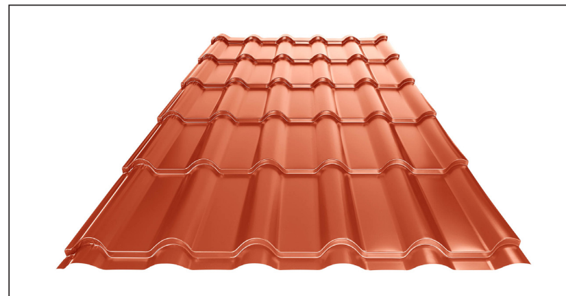
L – OPTIMALNA DOLŽINA KRITINE ZA MODUL 350 mm