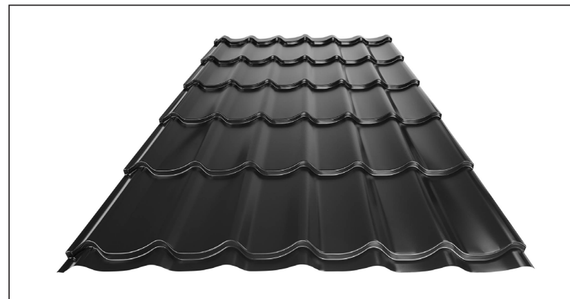
L – OPTIMALNA DOLŽINA KRITINE ZA MODUL 350 mm