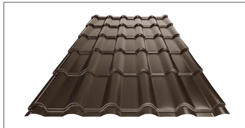
L – OPTIMALNA DOLŽINA KRITINE ZA MODUL 350 mm