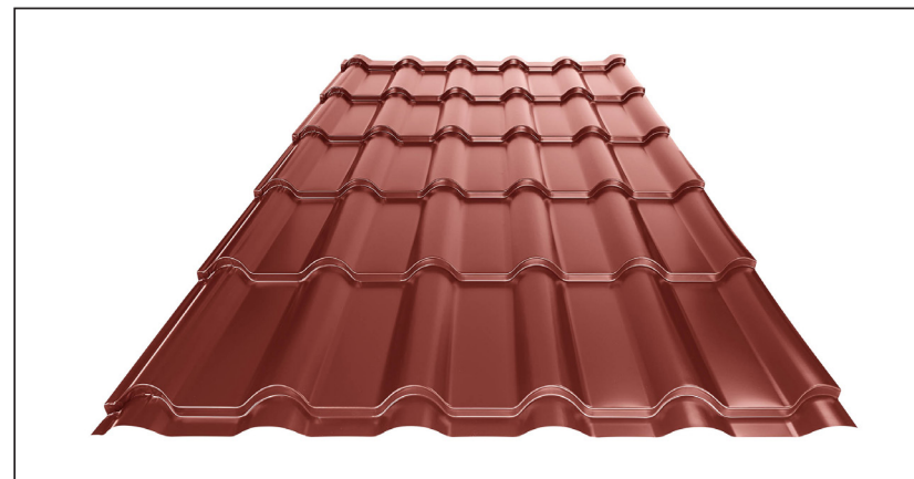
L – OPTIMALNA DOLŽINA KRITINE ZA MODUL 350 mm