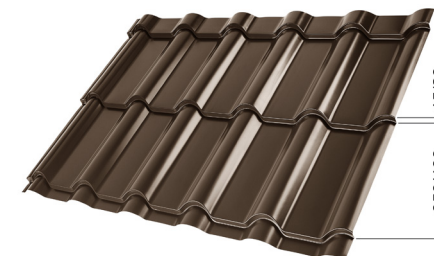
L – OPTIMALNA DOLŽINA KRITINE ZA MODUL 350 mm