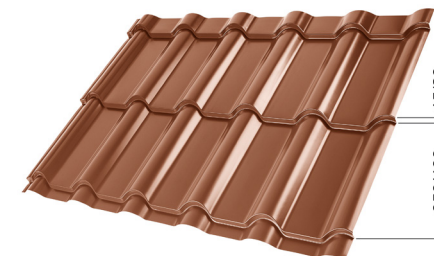
L – OPTIMALNA DOLŽINA KRITINE ZA MODUL 350 mm