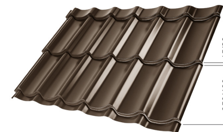
L – OPTIMALNA DOLŽINA KRITINE ZA MODUL 350 mm