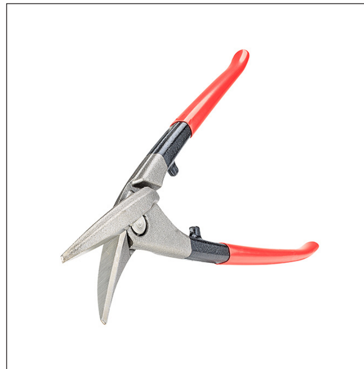
Visoko legirano orodjarsko jeklo