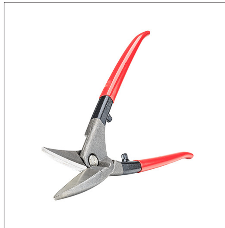
Visoko legirano orodjarsko jeklo