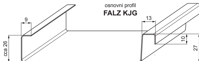
osnovni profil FALZ KJG