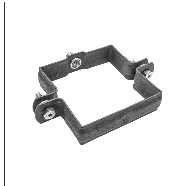
ANM Aluminij barvni W.15 – Antracit W.15 – RAL 7016