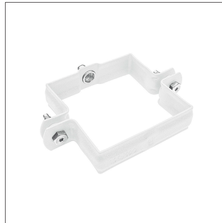
BM Aluminij barvni W.15 – Bela W.15 – RAL 9010