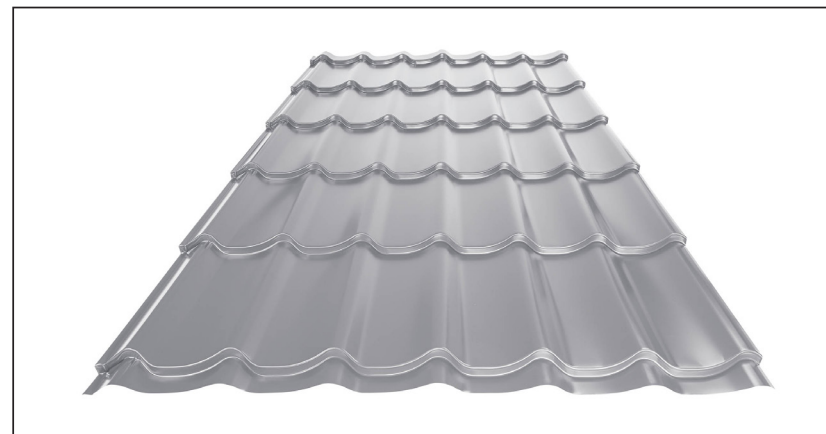
L – OPTIMALNA DOLŽINA KRITINE ZA MODUL 350 mm