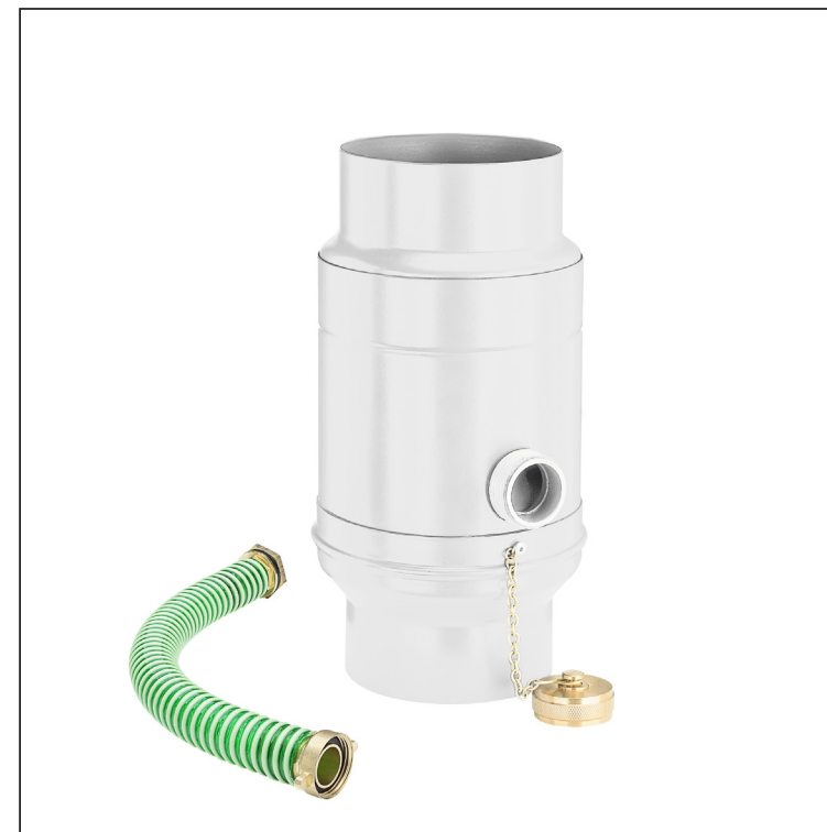
B Hliník lakovaný – Biela – RAL 9010