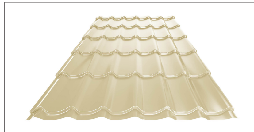
L – OPTIMÁLNA DĹŽKA KRYTINY PRE MODUL 350 mm