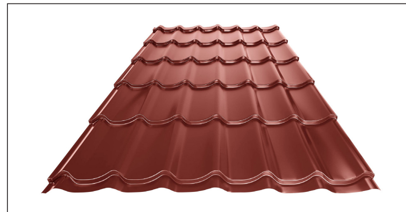
L – OPTIMÁLNA DĹŽKA KRYTINY PRE MODUL 350 mm